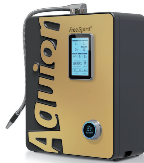
Neues Kapitel einer Erfolgsstory: Der Aquion FreeSpirit

Jetzt kann unser wichtigstes Lebensmittel, das Trinkwasser, gezielt moduliert werden – je nach Bedürfnis und persönlicher Lebenssituation. Dies macht das